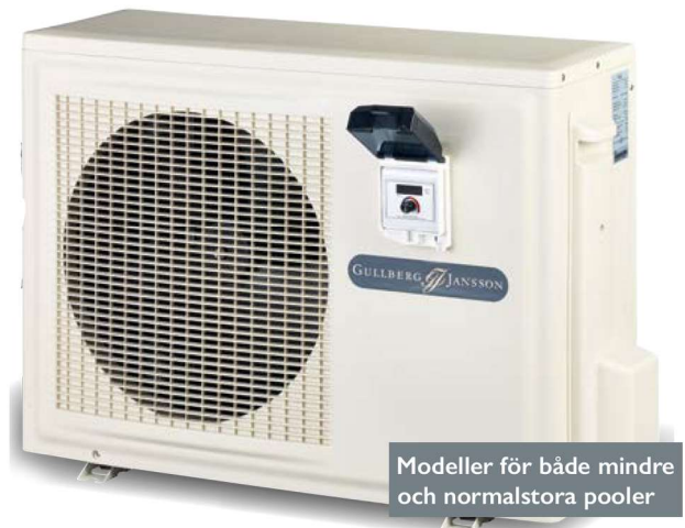
Modeller för både mindre och normalstora pooler